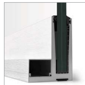
VIEW GLASS PRO (ojaèana)